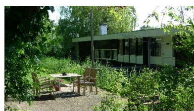
Entree tuin Bartmanzboot