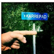
Bij 't Karrepad