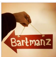
Bij het hek